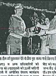
किरण रिजीजू के साथ संगीत कार्यक्रम में लोग।

किरण रिजीजू ने कहा, जवानों में जोश भरता है संगीत।